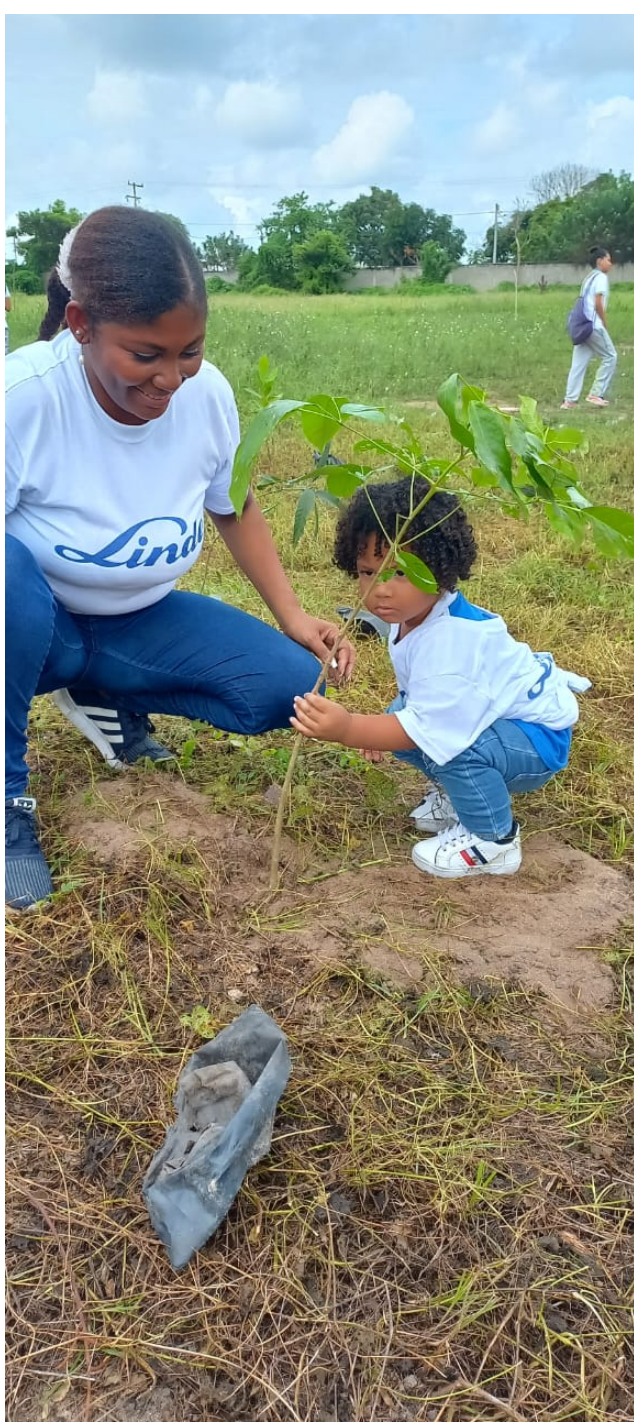
Elaborado por: Walter Rodriguez Gallego