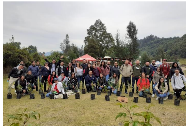
Imágenes 3, 4, 5 y 6: Siembra en Colaboración con la empresa Controles Empresariales S.A.S. Cajicá, Cundinamarca. Febrero 8 de 2022.

Elaborado por: Valentina Gómez Promotora Ambiental